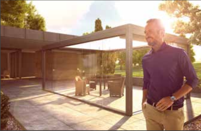
Schiebe-Systeme Sliding Systems