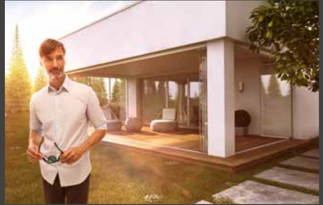
Schiebe-Dreh-Systeme Slide and Turn Systems