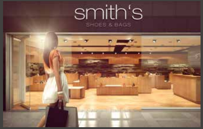
Horizontal-Schiebe-Wand-Systeme Horizontal Sliding Wall Systems